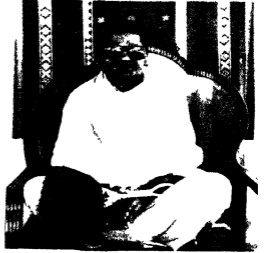
स्वामिन्श्री जानयोगा भारतक चाम्कानिजी मुन्ढबिद्रा